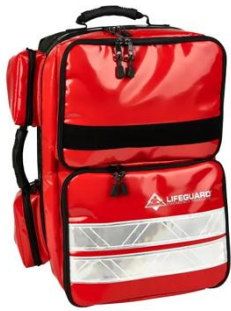
rot Art. Nr. M8R002RO

Der Rucksack ist in folgenden Farben erhältlich