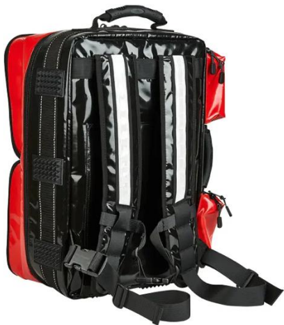
ABB. Rückseite mit Tragegurte