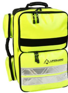
gelb Art. Nr. M8R002GE