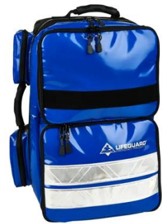
blau Art. Nr. M8R002BL