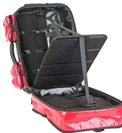
ABB. geöffneter Rucksack